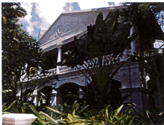
▲具有一定城市美感水準·乾淨且綠意盎然的市容