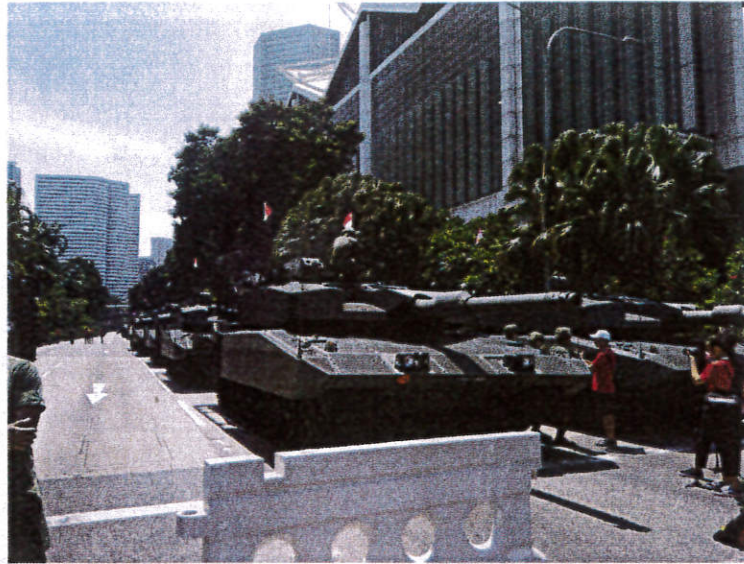
▲新加坡國慶預演，相較之下台灣國慶氛圍與意識並不濃厚。